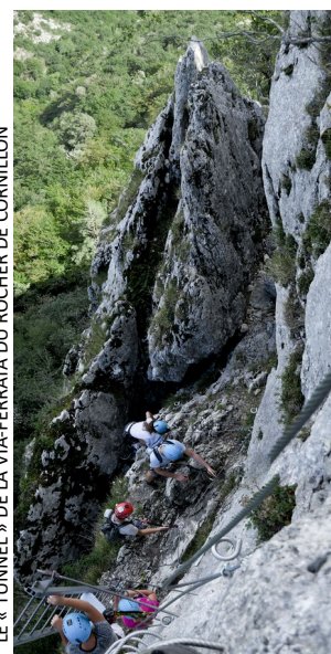
LE « TUNNEL » DE LA VIA-FERRATA DU ROCHER DE CORNILLON