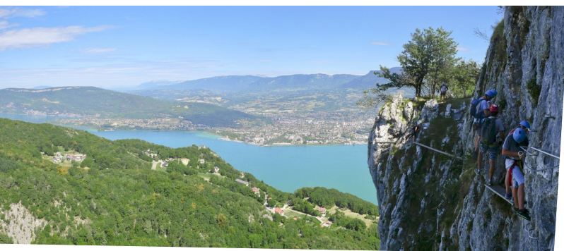
PREMIERS PAS SUR LE ROCHER

Les premiers pas font office de test, un premier passage permet d'appréhender le vide en « basculant » sur la falaise face au lac, alors masquée. Si ces premiers pas sont trop difficiles mieux vaut faire demi-tour ou sortir au premier échappatoire qui arrive très vite et renoncer car le parcours paraîtrait alors assez long.