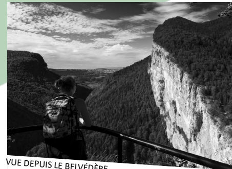
VUE DEPUIS LE BELVÉDÈRE

Plus d'infos sur tracesmondeetmerveilles.com